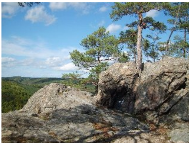
První cíl naší trasy: vyhlídka Velká skála.

Trasa výletu v okolí obce Senorady je virtuálně vyznačena pomocí GPS navigačního systému. Tzn. že stačí z těchto stránek stáhnout a do své GPS navigace uložit soubor, ve kterém je trasa uložena. GPS navigace vás pak provede celou trasí. Pokud GPS navigaci nemáte, pak si můžete popis trasy stáhnout do mobilu a nebo vytisknout na papír. Trasu lze též prohlédnout pomocí programu Google Earth. Odkaz na Google Maps zobrazí trasu v mapce, kterou lze zvětšovat, měnit typ mapy, apod.