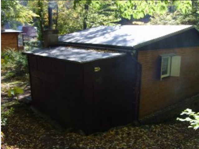
Z vyhlídky se vrátíme zpět na stezku a jdeme lesem dolů k řece až narazíme na chatabou oblast.