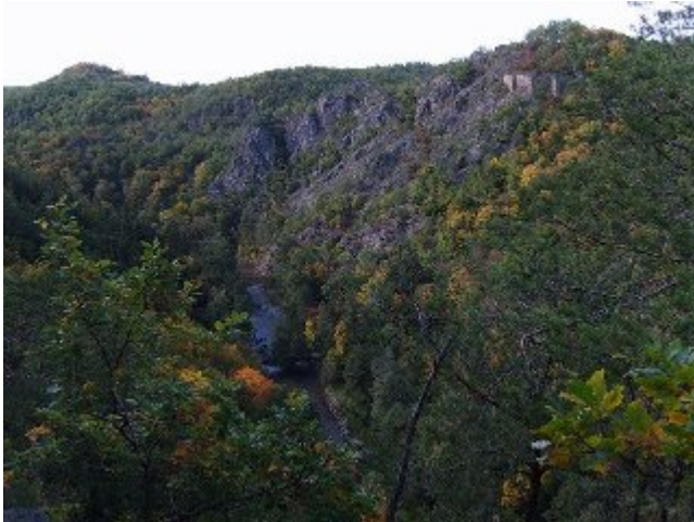
Pohled ze Zdeňkovy vyhlídky: