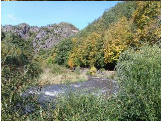
A to už jsme u řeky Oslavy.